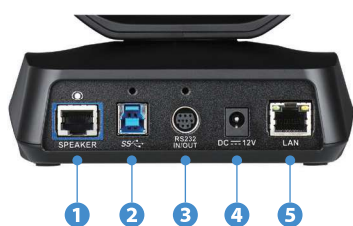
Webカメラユニット 背面